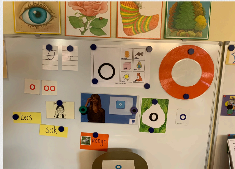
Letter O: Kleuters