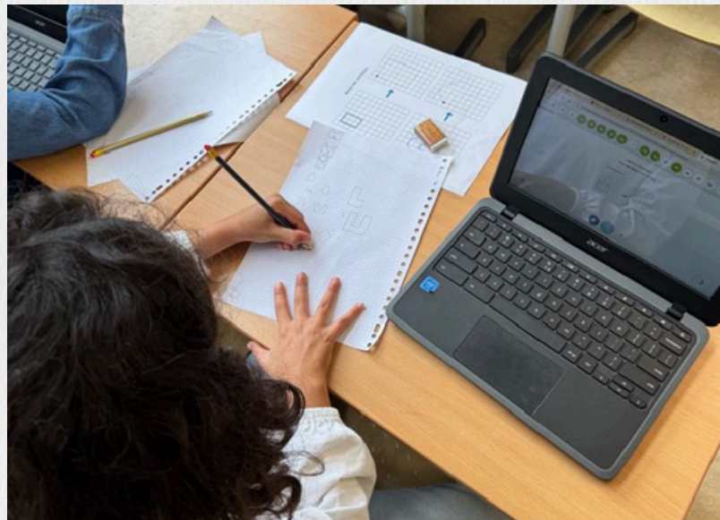
Rekenen groep 5