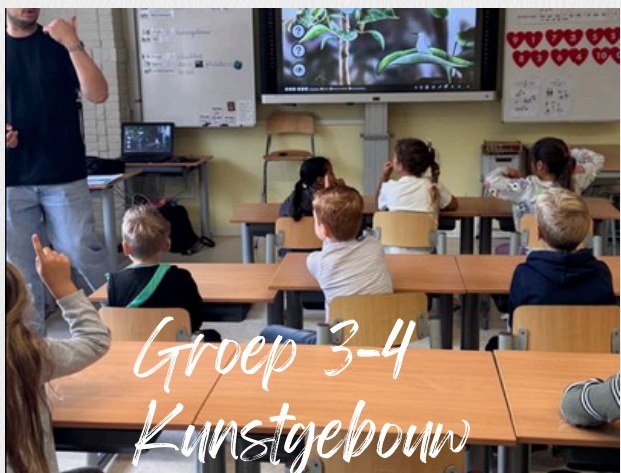
Groep 3-4 Kunstgebouw