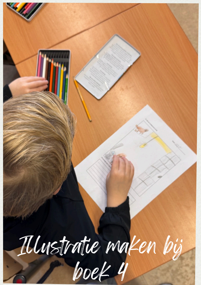
Illustratie maken bij boek 4